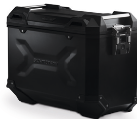
TRAX ADV M (37 l): 49 x 23 x 37 cm / 5,1 kg TRAX ADV L (45 l): 49 x 28 x 37 cm / 5,5 kg