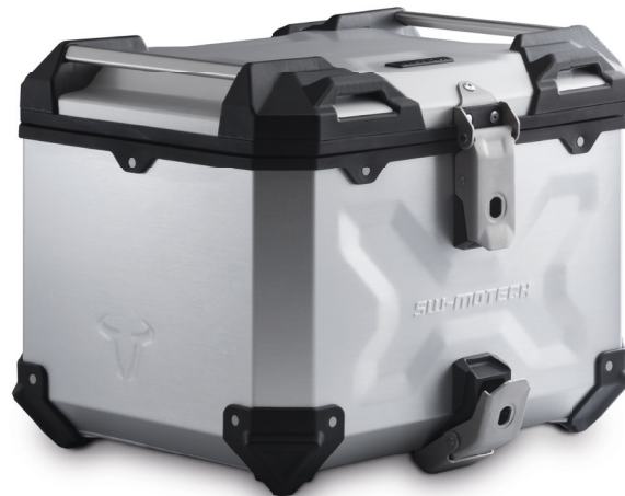
Topcase / Top case / Topcase: 38 l / 41 x 34 x 33 cm / 4,7 kg