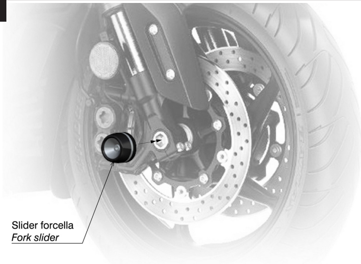
Slider forcella Fork slider

Consigli per facilitare il montaggio: pulire e sgrassare la parte interna del perno ruota. Non rimuovere l'o-ring dall'expander.