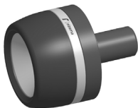
LATO SINISTRO/ LEFT SIDE