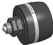
LATO DESTRO/ RIGHT SIDE

ITA ⚠ – Prima di iniziare il montaggio verificare la completezza del kit. Il livello di difficoltà e il tempo di montaggio non comprendono lo smontaggio dei componenti OEM. Attenzione: Prima di procedere all'installazione, assicurarsi che la moto si trovi in una posizione stabile, perchè la moto in bilico potrebbe causare danni a cose o a persone o ferimenti. ATTENZIONE: PER LA PULIZIA DEL PRODOTTO NON UTILIZZARE DETERSIVI, SGRASSATORI, PRODOTTI AGGRESSIVI O SPUGNE ABRASIVE CHE POTREBBERO ROVINARE O GRAFFIARE IL PRODOTTO, MA UTILIZZARE ESCLUSIVAMENTE DETERGENTI NEUTRI CON ACQUA FREDDA.